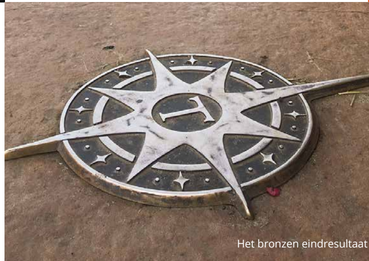
Het bronzen eindresultaat

Brons is een materiaal dat zich makkelijk laat bewerken met diverse schuur- en slijpmaterialen. Daarnaast is het mogelijk aan een bronzen of aluminium beeld te laten lassen.